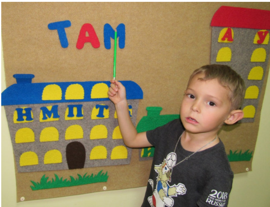
Работа с пособием «Буквоград»