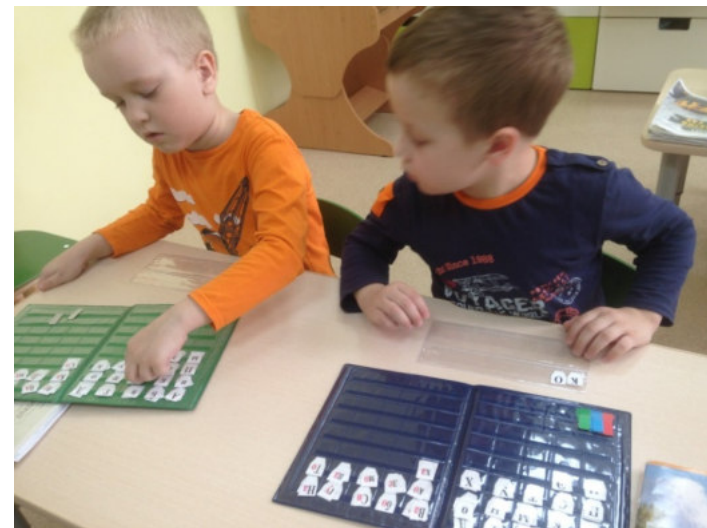
Работа с кассой букв