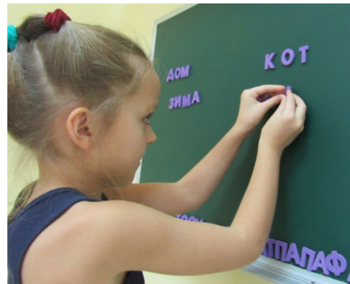
Составление слов, звуковой анализ слов