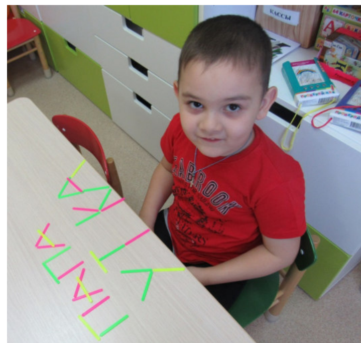
Работа по тетради, со счётными палочками